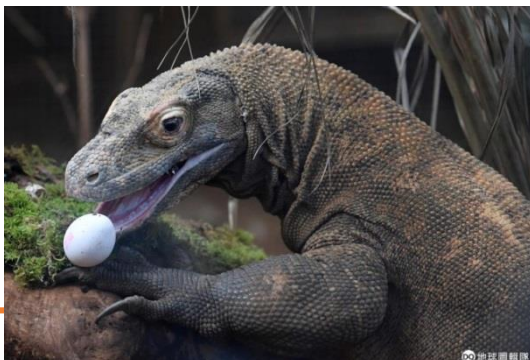
圖：科摩多巨蜥