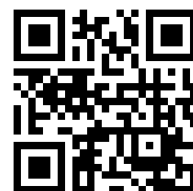
臺北市中山國小 QR Code

(四)實施計畫、報名表、審核表、課程表及錄取名單等訊息可至本校網站之「最新消息」查詢。