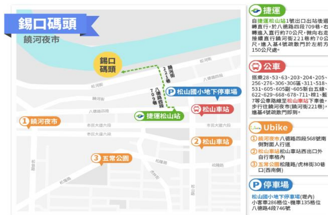
圖；臺北市藍色水路主要碼頭介紹

民國 98 年臺北市政府整修周邊的安全措施，親水步道整體景觀，並串連錫口碼頭與人行步道。錫口碼頭鄰近彩虹橋，因此又被稱為彩虹碼頭。碼頭附近還有松山慈祐宮、饒河觀光夜市等特色景點，有吃有玩，成為另一個觀光新地標。