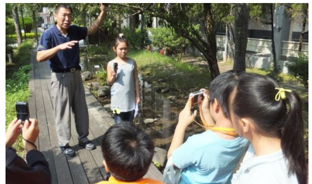
志工老師帶領學員學習拍攝與實際進行採訪