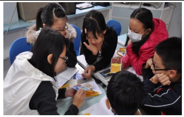
透過有系統的教學課程帶領孩子進入影片紀錄的世界