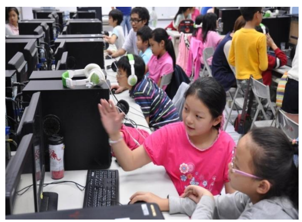
運用數位影音編輯軟體，讓孩子的心中想法可以無遠弗屆的表達