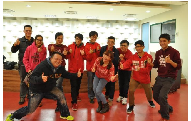
邀請貴賓及家長來看孩子們的紀錄片成果，給予孩子最大的讚美與掌聲