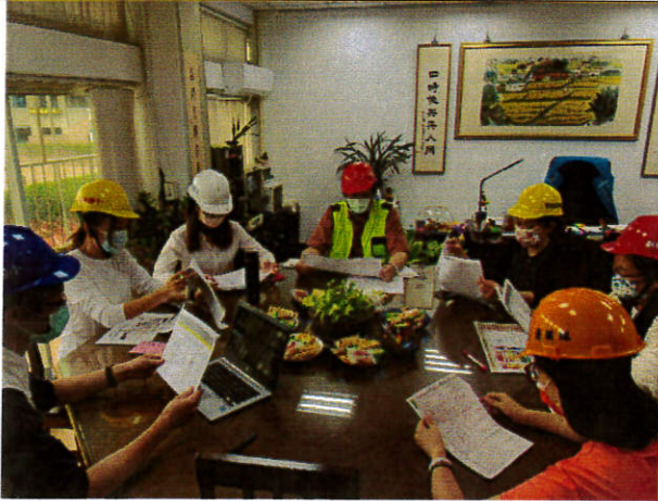
照片1：學校分工討論會議