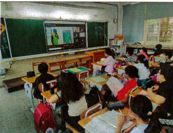
照片5：線上或實體授課實況