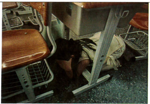
照片6：學生防空避難動作實作