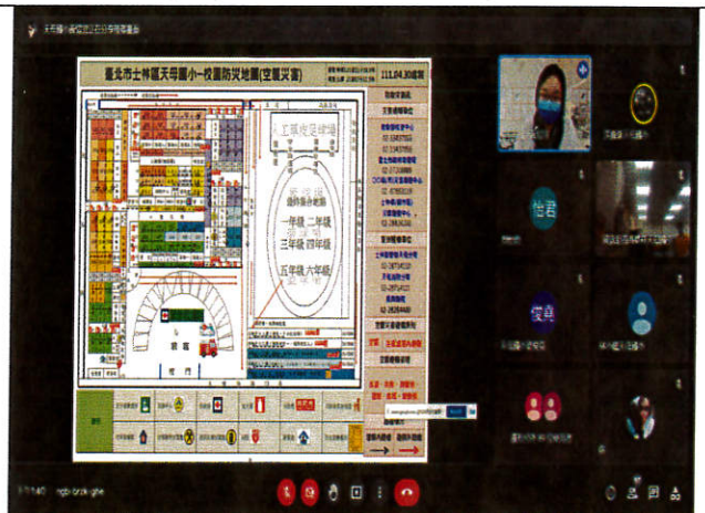
照片4：線上或實體授課實況