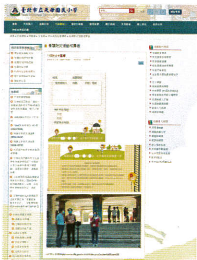
學校校網宣導及朝會